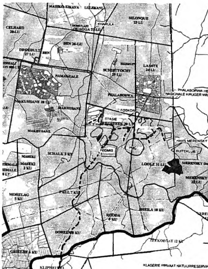
Figure 2: Studiegebied (De Ridder 2000:129).

gevolge van spesifieke aksies en om sodoende volledigheid en presisie in die analise te verseker. Verder is die matriks 'n eenvoudige metode van evaluering en vereis nie uitgebreide materiaal en menslike hulpbronne nie. 'n Matriks word beskou as 'n reeks numeriese voorstellings van inligting wat 'n kompakte van die inligting toelaat (Field & MacGregor 1987:216).